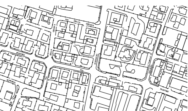
Base aerofotogrammetrica comunale

Variante generale al Piano regolatore generale (Dgr. n. VII/14.161 del 08/08/2003)