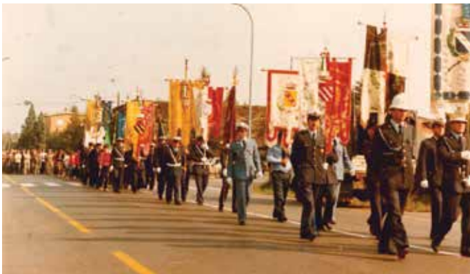
Ottobre 1983 - La marcia silenziosa contro i sequestri di persona, in occasione del rapimento di Elli Ambrogio