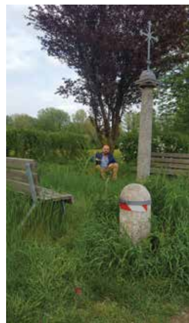
Via Lazzaretto, ingresso percorso vita