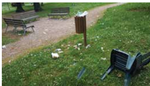
Parco di Villa Sartirana