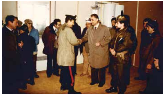
Gennaio 1981 - Cerimonia di consegna dei prefabbricati realizzati dalla "Colonna Giussano" a Teora

Per questo motivo, è da ritenersi un gesto dovuto e pieno di significato profondo collocare in un edificio pubblico una targa commemorativa alla Sua memoria.