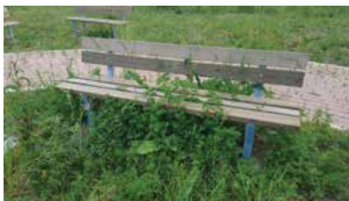
Giardinetti Paina, Via Trieste