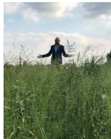
Parco delle Stelle