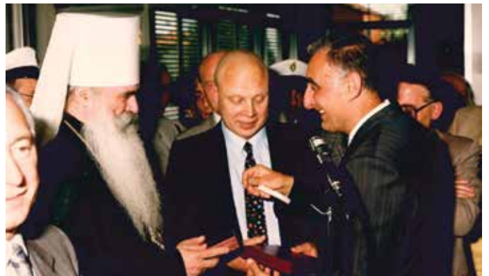
25 maggio 1987 - Cerimonia di consegna della campana dell'amicizia al Console sovietico e al Patriarca di Mosca Pitirim