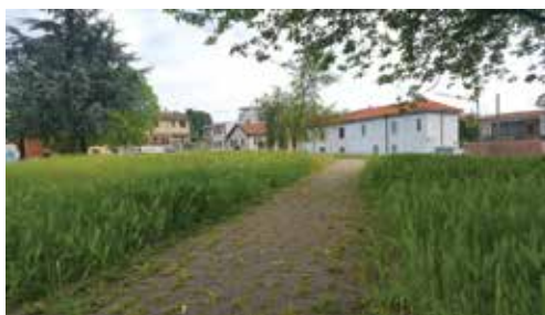
Giardino di Via Oberdan-Via De Gasperi, le romanelle