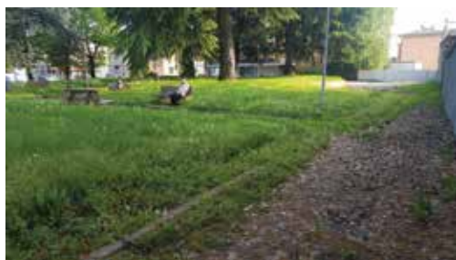
Parco di Piazza Repubblica