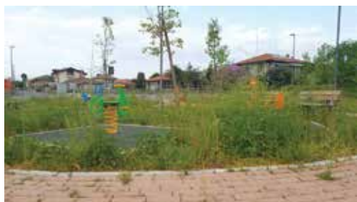
Giardinetti Paina, Via Trieste