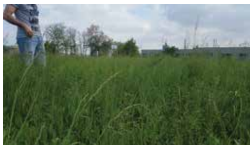
Noceto di Birone