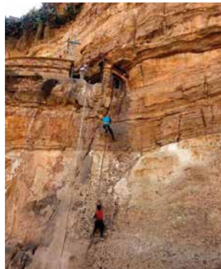
Salita al monastero Dabra-Damo (Etiopia)

Lei scrive? “Sì, i miei sono libri di testo utilizzati presso l'Istituto Biblico dell'Università Pontificia a Roma, fre-