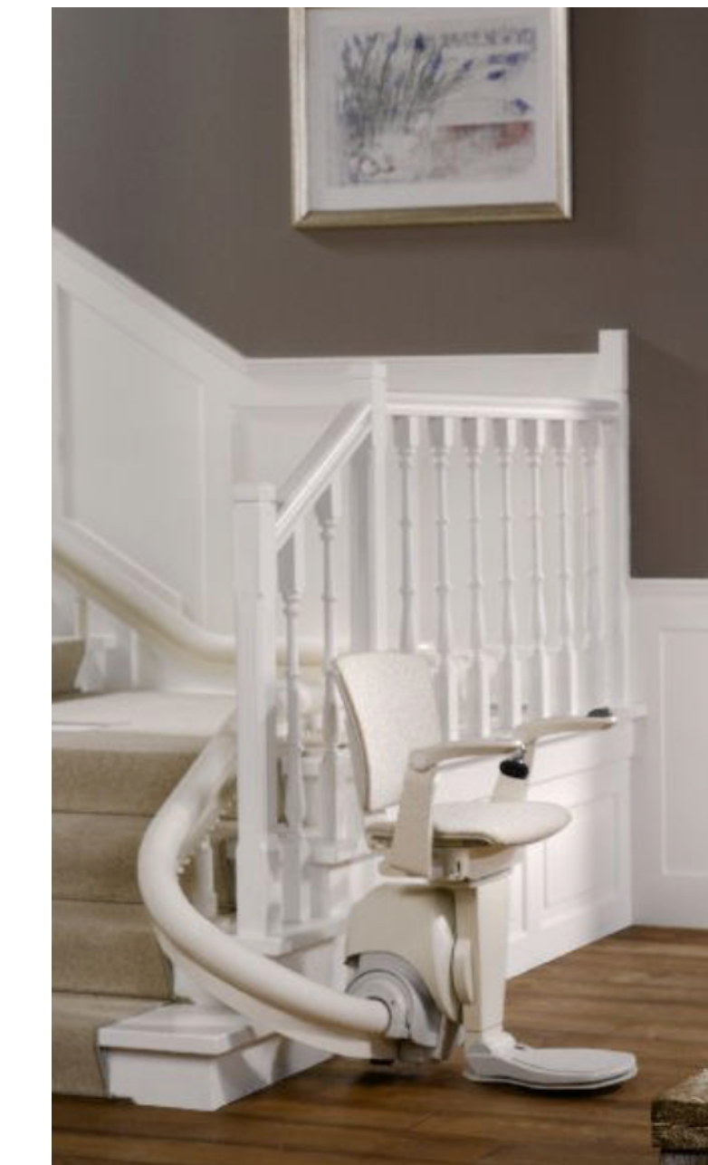
Tipologia montascale previsto