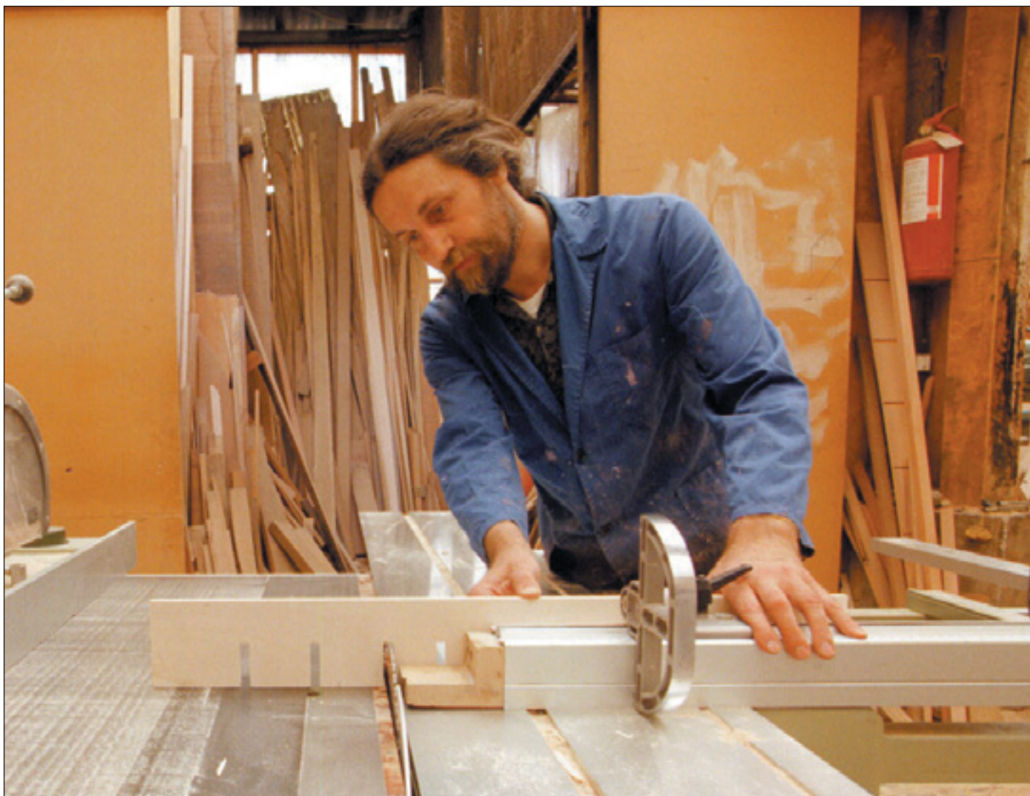
Al lavoro in cerca di strumenti per uscire dalla crisi economica