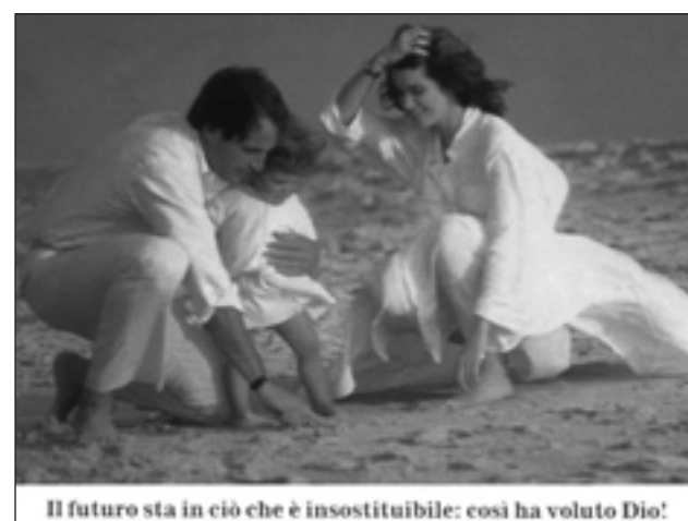
Il futuro sta in ciò che è insostituibile: così ha voluto Dio!

3) Nell'ambito territoriale del Comune di Gius-