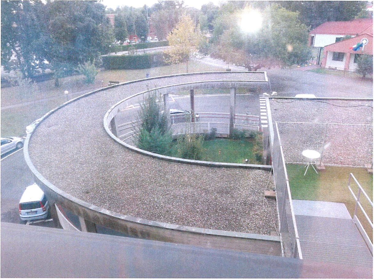
Vista dall'alto della pensilina