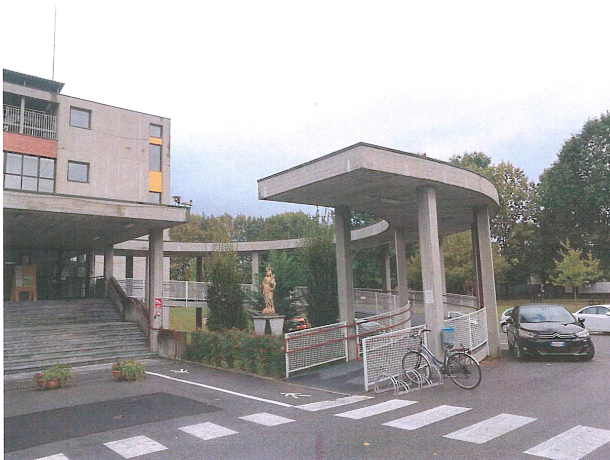
Vista generale della pensilina

La pensilina che copre la rampa di ingresso alla Residenza presenta diversi segni di infiltrazioni di acqua e necessita di urgenti lavori di manutenzione: si provvederà alla rimozione del ghiaietto esistente e alla posa di un nuovo manto costituito da due membrane di cui quella superiore con una protezione di scaglie di ardesia incollate a caldo sulla faccia a vista.