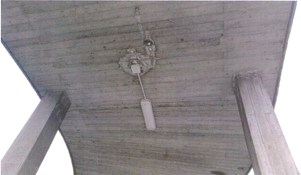
Dettaglio di una infiltrazione