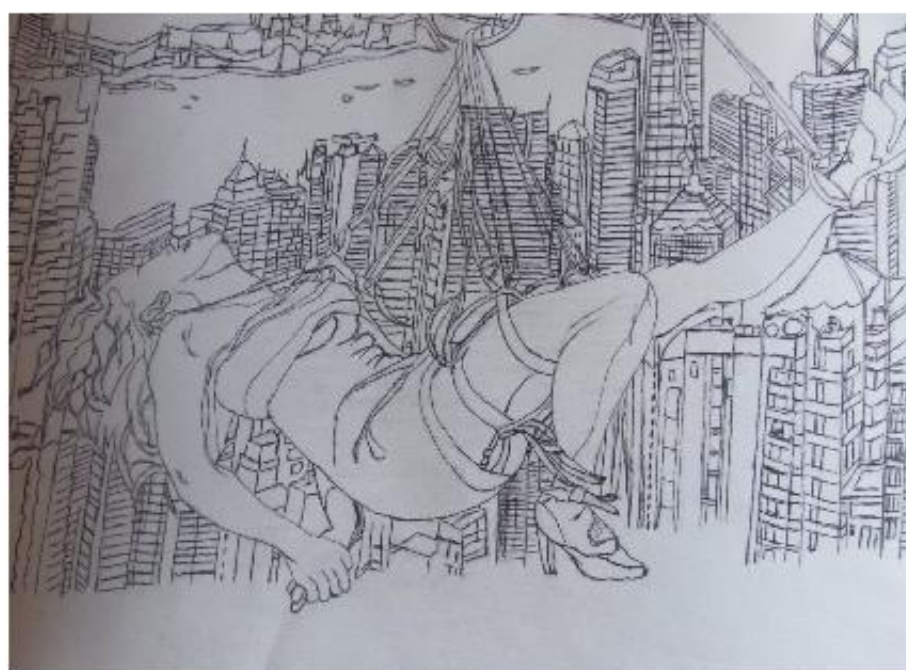
"Un salto nel buio", penna su carta, 30x40