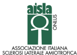
Associazione Italiana Sclerosi Laterale Amiotrofica (AISLA)