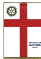
Rotary Club “Milano Fiera”