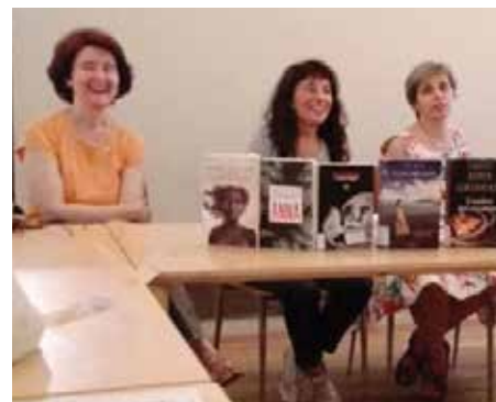
Gruppo di lettura E qui ... libri – giugno