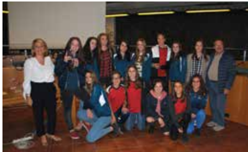
Squadra CALCIO A 7 - ALLIEVE FEMMINILI CSI miglior squadra dell'Associazione GS PAINA 2004