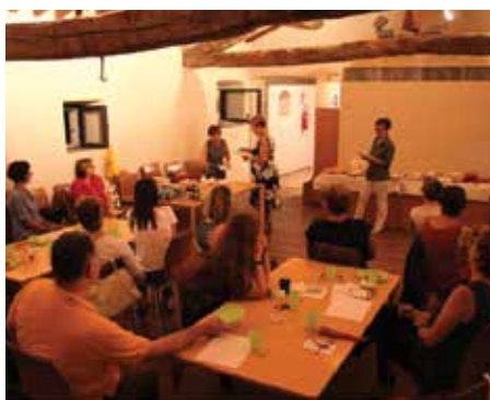
Gruppo di lettura Giocalibro – luglio