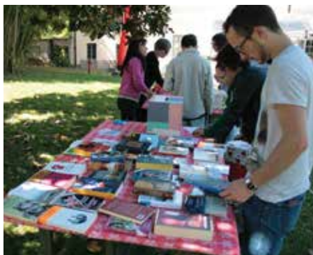
Io leggo perché – maggio