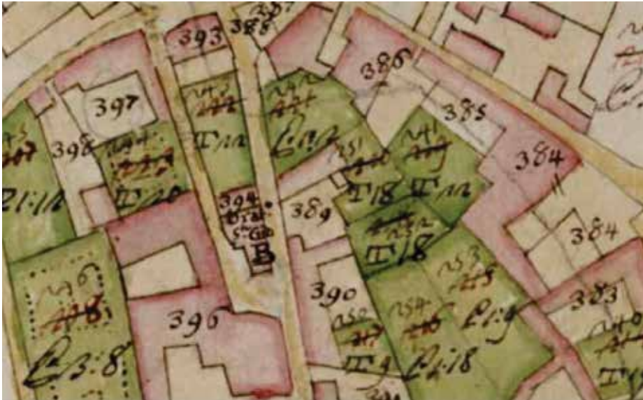
Dai disegni del Catasto Teresiano: con il numero 386 l'abitazione della famiglia Gottiери, prospiciente l'attuale via Umberto I. Al numero 242 il giardino di casa, mentre al numero 387 altre case di proprietà che venivano affittate

In quanto alla casa di residenza dei Gottiери a Giussano, questa passò prima alla famiglia Gianorini (ricchissimi notai ed avvocati milanesi originari di Valbrona che a Giussano consolidarono un ingente patrimonio immobiliare comprendente anche la Villa Pedetti-Gianorini, ora Viganò) e poi alla famiglia Sala, che via abita tuttora.