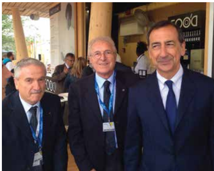
All'Expo, a sinistra, con l'allora commissario Sala

Ci dà qualche cifra? Numericamente si può sintetizzare in questo modo: il 75% degli associati lavora ma sta aspettando una vera ripresa del mercato interno che un po' tarda ad arrivare, mentre il 25%