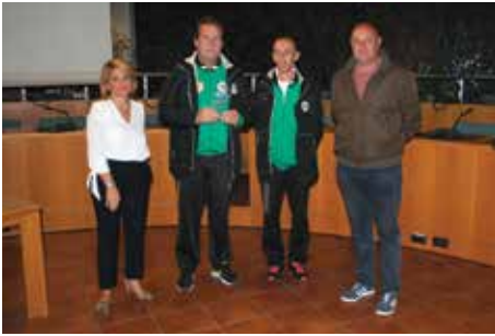
SQUADRA ESORDIENTI 2004 B - miglior squadra della Società AS VIS NOVA GIUSSANO