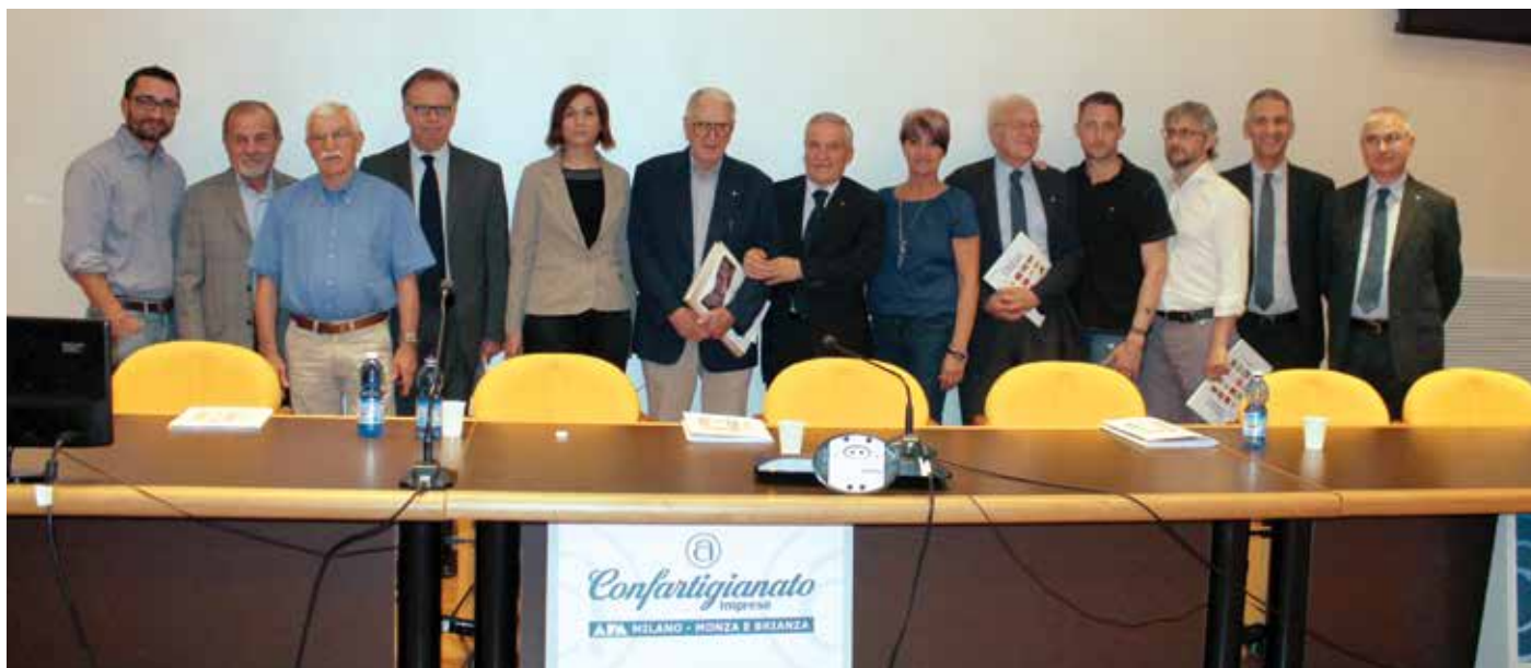
Al centro, con l'attuale consiglio Apa Confartigianato di Milano - Monza e Brianza.

C'è altro? Sì, opera anche nel sociale collaborando con Comuni, parrocchie, associazioni, scuole e istituti. Qualche esempio: il contributo in termini di uomini, progettualità, macchine e organizzazioni in caso di calamità, per esempio in occasione di importanti eventi sismici, dal Friuli (1976) all'Irpinia (1980), per il quale vennero costruite, installate, allacciate e ammobiliate 13 casette in 40 giorni in quel di Teora (un record, un'operazione mai vista prima con il concorso di tanti artigiani, il Comune, la parrocchia e tanti volontari di ogni settore e rimasta ineguagliata nonostante i tanti episodi sismici in Italia fino ai giorni nostri). Questa operazione è stata premiata ancora nel 2017 dalla Regione Campania che, avendo costituito una vasta area artigianale