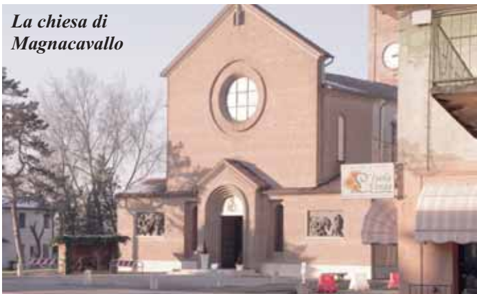
La chiesa di Magnacavallo

Domenica 9 dicembre 2012, una delegazione cittadina, guidata dal sindaco con il parroco, il Gruppo Volontari della Brianza e la banda DAC Giussano Musica, ha partecipato alla cerimonia della nuova benedizione della chiesa ristrutturata di Magnacavallo, alla presenza delle autorità locali e del vescovo di Mantova S.E. Mons. Roberto Busti. La raccolta fondi ha nel frattempo superato quota 60mila euro