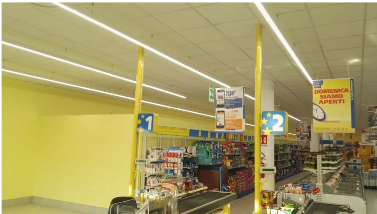
Fotografia n. 04 – zona di ampliamento in area vendita