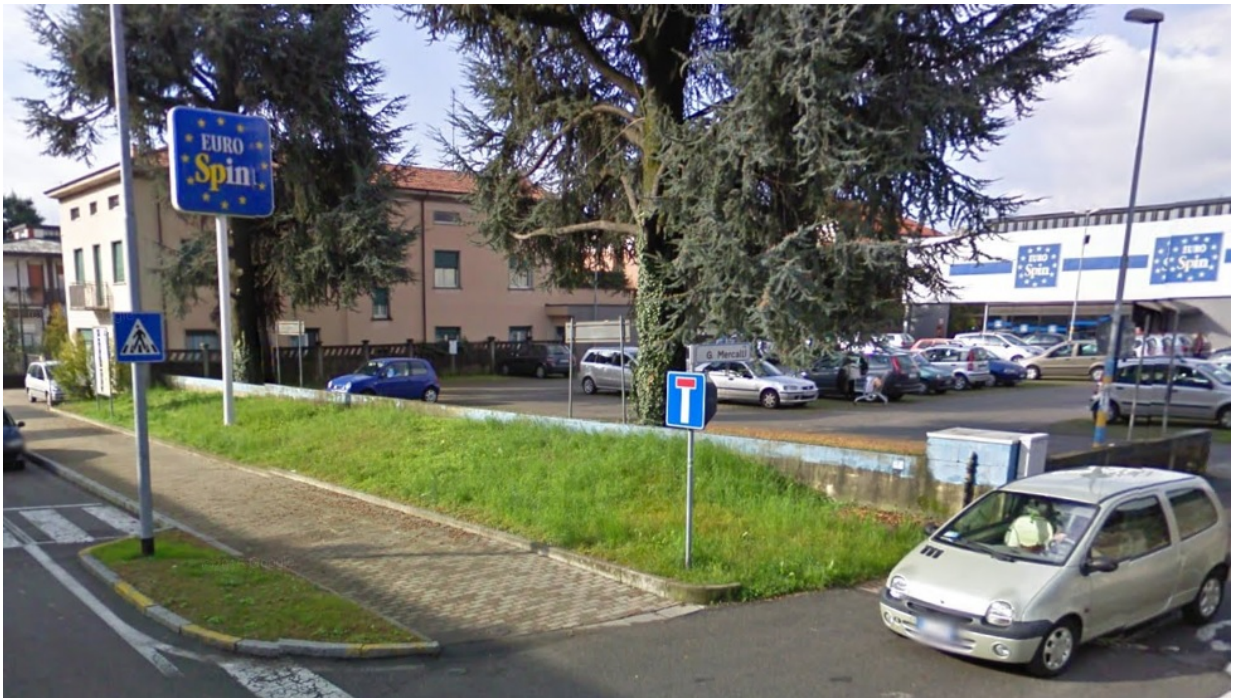
Fotografia n. 02 – Via G. Mercalli