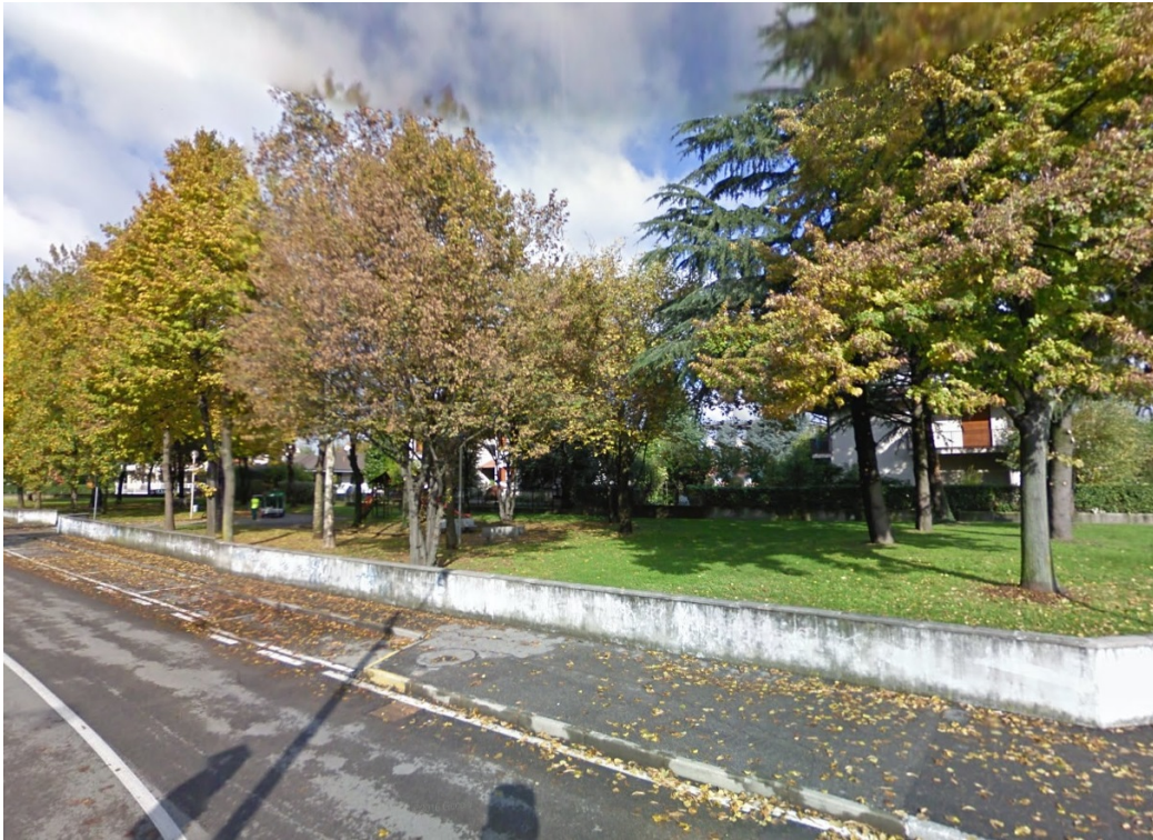
Fotografia n. 06 – vista del parco giochi pubblico di Via G. Pastore