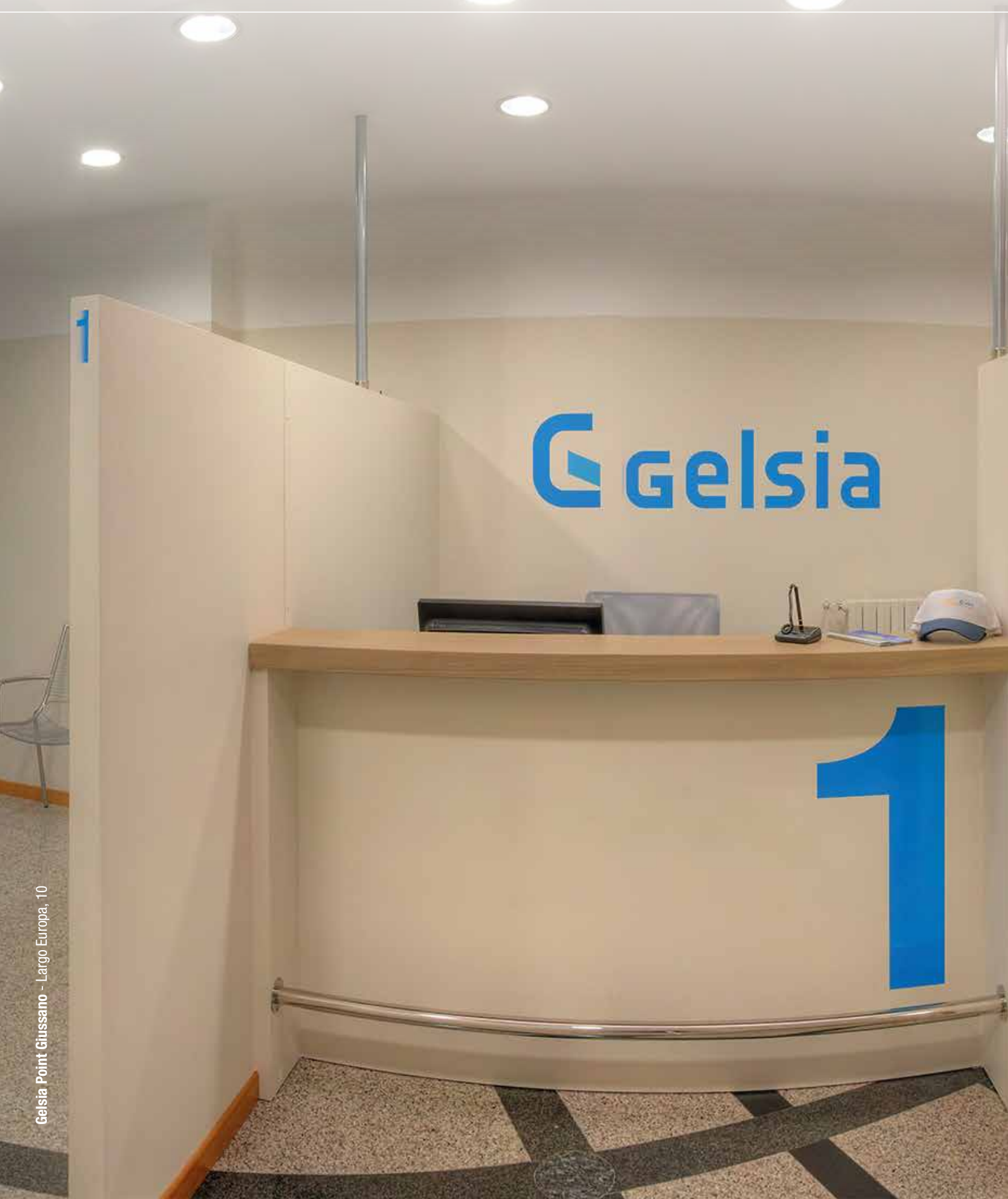
Gelsia Point Giussano - Largo Europa, 10