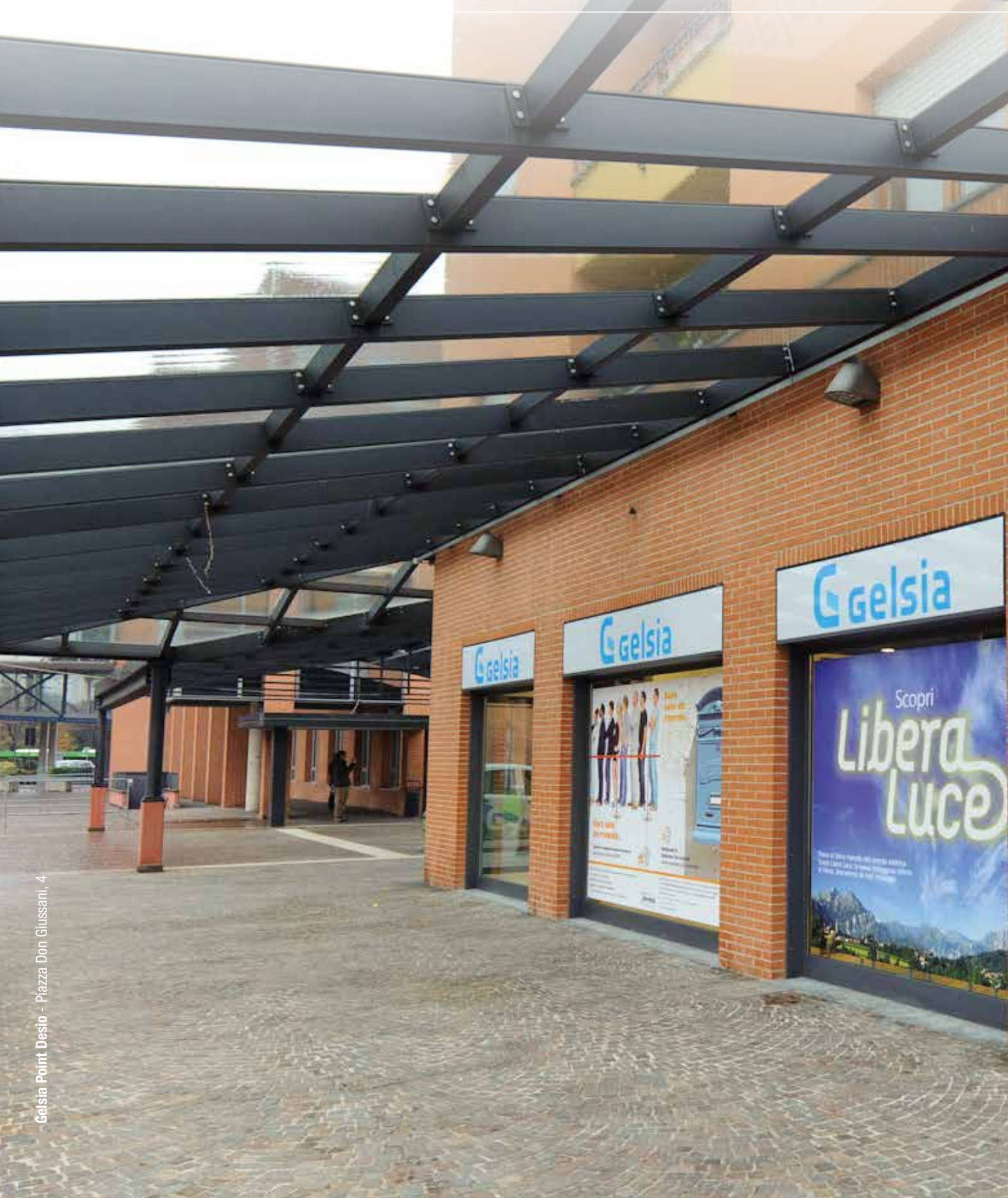
Gelsia Point Desio - Piazza Don Giussani, 4