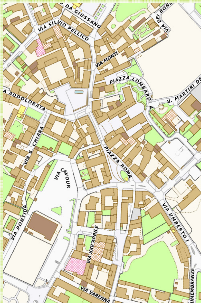
Giussano in una restituzione tematizzata attuale