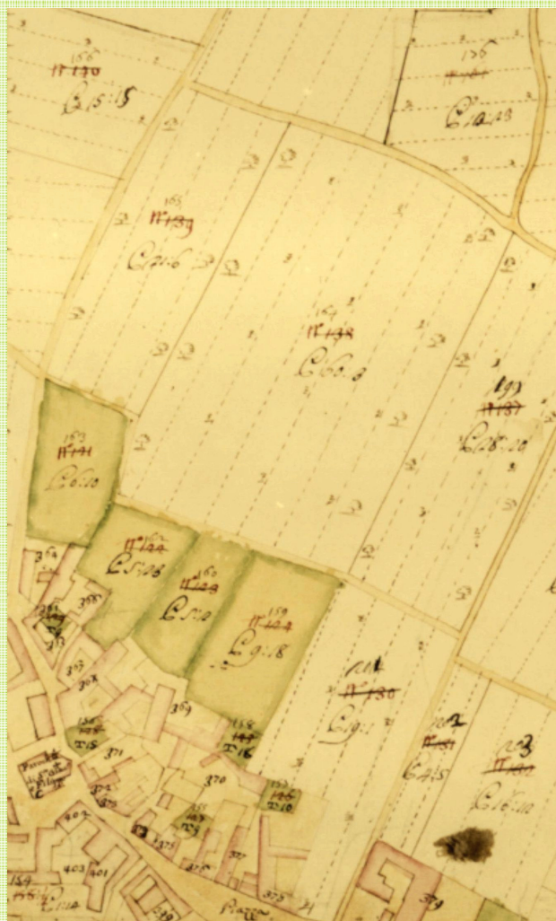
Giussano nella cartografia storica